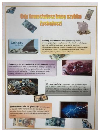
Klaudia Początko 2THLa